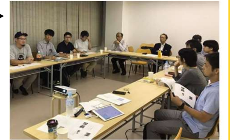
▶ 計画検討会の様子

錦二丁目地区の約4割を占める道路などの 公共空間を利活用して、地域の課題を解決する事業を検討 しました。検討会を通して、地域住民や事業者の意見を聞きながら「賑わい創出」、「安心安全」、「まちの美観・エコ」につながる 9つの事業メニュー を抽出しました。また、その事業メニューのうちランチモール事業など先導的に取り組む事業を選定しました。