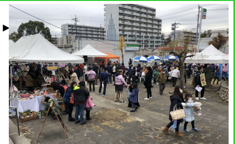
▶ 社会実験ひだまりマーケツトの様子

平成30年度にアンケート調査やワークショップを通して、地域の現状や課題やコミュニティ拠点のあり方を検討するなどまちづくり構想づくりに取り組みました。平成31年度は、地域のコミュニティ拠点として求められているもの等を把握するため 社会実験 を行い、そこで得られた成果をまちづくり構想案として取りまとめました。