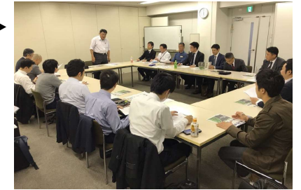
▶ 企画委員会の様子

平成30年度に取りまとめた「まちづくり構想（素案）」をベースに、平成31年度は、地域でエリアマネジメント活動を推進するにあたっての「まちづくりの方向性」、「必要な組織体制」、「オープンカフェなどの具体的な事業」を検討し、 久屋大通発展会エリアマネジメント構想 として取りまとめました。