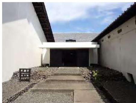
写真5 収蔵庫風除室