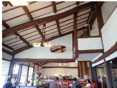
写真4 The Club カフェ&ワインバー