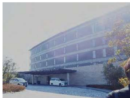
写真 3 The Bay Suites 外観

中井) The Bay Suites も、茶色い外壁にしなればいけなかったのかな。それこそ私がこの近くに設計した特養も、環境省から景観に配慮してほしいと言われて、真っ白な外壁はアウトでしたね。