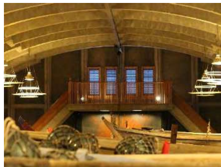
写真 3 妻側の換気口

大月) 当初から厳しかったようですね。でも「まず、コレクションを増やすことが大事だ」、ということで頑張られてきたそうです。ご尽力された館長の石原義剛さんは、昨年亡くなられましたね。海の博物館はもともと石原義剛さんの父親、政治家でもあった円吉氏の働きかけにもよる民間設置によるものだそうです。鳥羽市立となっているのは、その設置主体であった東海水産科学協会から市が施設を引き取ったことによります。それで同協会は今でも指定管理者として管理運営を担っています。ちなみに、現在のコレクション