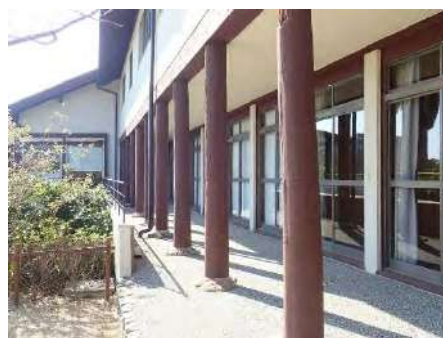
写真6 The Clubの前庭側

大月 移築は、ホテル設置にあたってコストを抑えるための方策だったわけですけど、結果的にはそれがこのいい財産になっていますね。