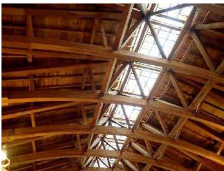
写真7 展示B棟トプライト