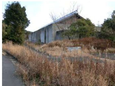
写真 9 志摩ミュージアム