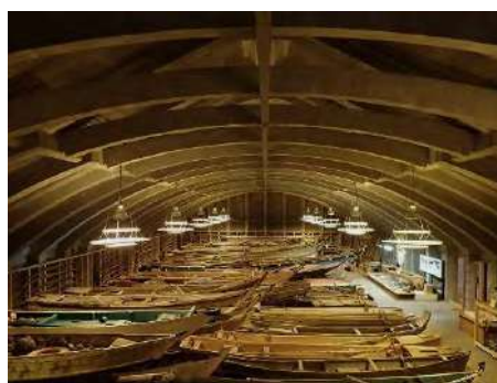
写真 4 PCを使用した収蔵庫