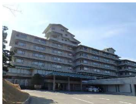
写真1 The Classic 外観