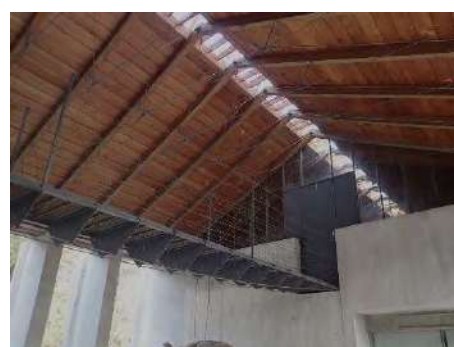
写真 10 二室を繋ぐ橋