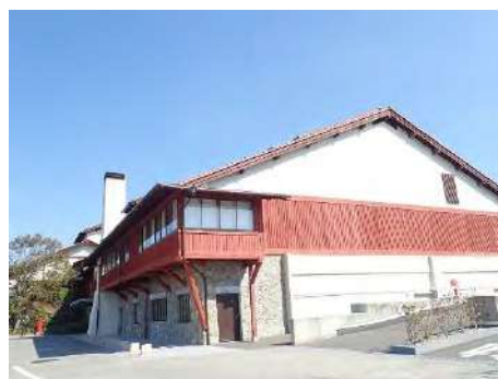
写真2 The Club 外観

The Clubのこちらから1階に見える下の部分(地階部分)が移築した時に客室と共に増築されていて、その客室部分も撤去され、この上の部分だけ(1,2階)が、もともとのもののようです。The Clubは、設計時に「環境との調和・共存」をテーマにしている、The Classicでは、「環境との調和」が難しいという事で、「環境との対比・共存」をテーマにしたそうです。The Clubが低層のため、周辺環境との「調和」というのが成立するんですけど、The Classicは高層化する必要があった。だから対比的に、人工的なものと自然をコントラストにみせるっていうことをテーマに掲げたようです。