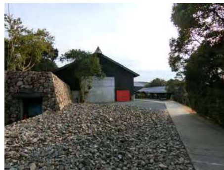
写真1 アプローチ 展示A棟とカフェテラスを望む

大月）私は、開館してそれほど経っていない頃来て以来なので、初めてみることになりますね。